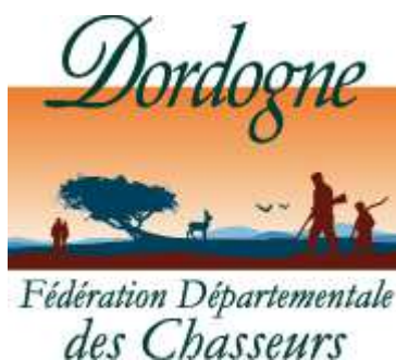
SCHÉMA DÉPARTEMENTAL DE GESTION CYNÉGÉTIQUE DE LA DORDOGNE 2018-2024

Retrouvez les dernières informations de la FDC24 dans ce Flash Infos de Mai 2021 Si vous ne voyez pas ce message correctement, consultez-le en ligne