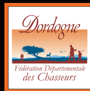
SCHÉMA DÉPARTEMENTAL DE GESTION CYNÉGÉTIQUE DE LA DORDOGNE 2018-2024